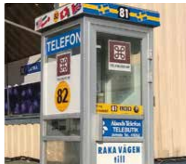
I den gamla telefonkiosken i Vargata finns Finlands troligtvis minsta museum med en minuställning om telefoner och åländsk telefoni.

Hyr gärna en kajak om du vill komma riktigt nära naturen. Vattnen kring Vårdö är perfekta för paddling med lite båttrafik och många vyer. Det finns också flera vandringsstigar i kommunen.