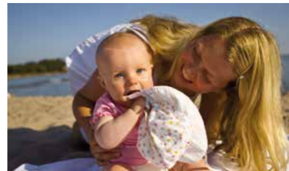
Familjer trivs vid Sandösunds camping. Här finns sandstrand, minigolfbana, café och möjlighet att hyra bastuflotte.

Finland's probably smallest museum is housed in the old telephone booth in Vargata. There is a mini exhibition on telephones and Åland's telephony history.